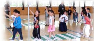
1年生交通安全教室